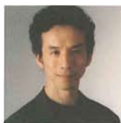
声の出演 今井朋彦 いまいともひこ

1973年生まれ。コミックスをはじめ、イラスト、絵画、アニメ、彫刻など多彩な領域で活動。代表作に「ケイヴウーマン」「幸福の花束」等。2007年、ノルマンディー国立演劇センター・ヴィジュアル部門の芸術監督に就任。